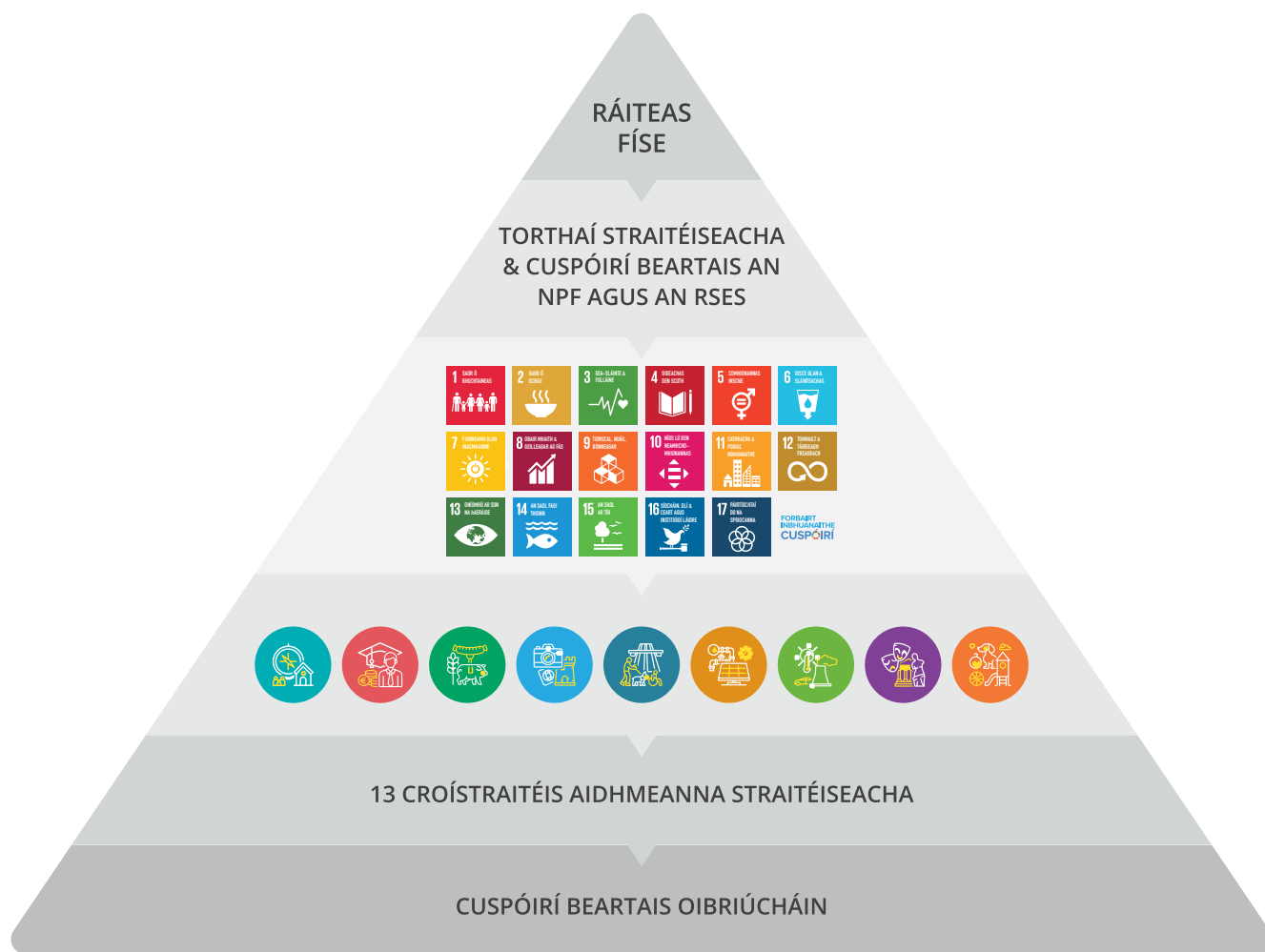
Fíor 1.4 Croí-Phrionsabail agus Cuspóirí Straitéiseacha